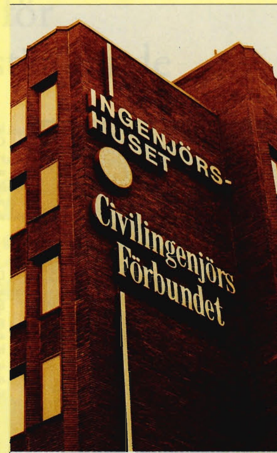
Den hetaste potatisen i årets gista har varit lönerna. Civilingenjörernas minskade köpkraft och bottenplacering i den europeiska löneligan ledde till att förväntningarna...

Den hetaste potatisen under året var lönerna och avtalsrörelsen. Civilingenjörernas minskade köpkraft och bottenplacering i den europeiska löneligan ledde till att förväntningarna på 1995 års avtalsrörelse var stora redan innan 1994 års lönehöjning var insatt på kontot. Civilingenjörernas stora missnöje med sin löneutveckling har löpt som en röd tråd genom pressklipp om övertidsslag, internationella löner och avtalsrörelse.