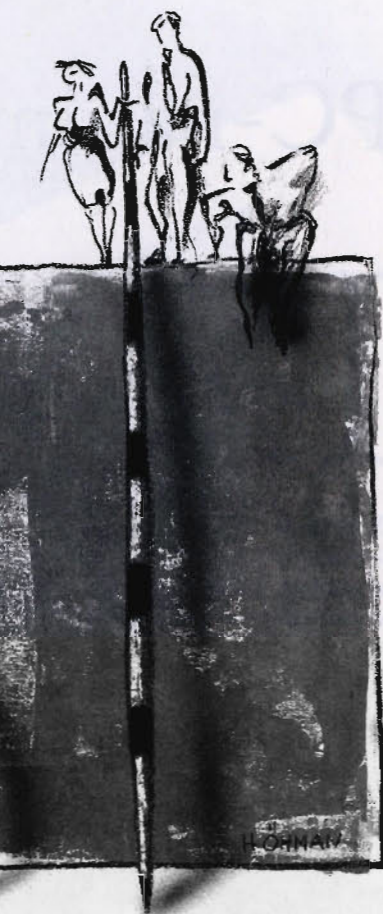
ILLUSTRATION: HÅKAN ÖHMAN

Arbetsgivarna och de lokala fackliga organisationerna i den statliga sektorn har inte kunnat enas i diskussionerna om hur strukturtillägget ska utformas. Många centrala förhandlingar genomfördes under hösten på arbetsgivarverket. Flera ärenden har också gått till särskild lönenämnd. Tolkningarna av kriterierna för översyn överensstämmer inte på