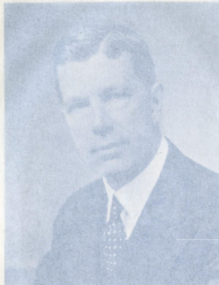
H. K. H. KRONPRINS GUSTAF ADOLF

Obs! I biografierna hava upptagits endast de utländska ordnar, som förvärvat i utländsk tjänst. För de ordensbeteckningar, som ej finnas upptagna i förkortningslistan, hänvisas till Statskalendern.