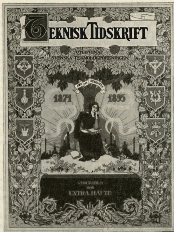
Omslaget till 25-årsjubileumshäftet.

Med anledning av jubileet utgavs även en festpublikation, innehållande en kortfattad historik över tidskriften samt artiklar om den tekniska utvecklingen på olika områden av olika fackmän. Jubileumshäftet hade ett omslag i färg utfört av arkitekt Bror Almquist, "framställande i förgrunden en kvinnogestalt, som vid foten av konstens och vetenskapens träd sitter djupt begrundande öfver häfderna, i fonden en uppgående sol bakom konturen af byggnader och industriella anläggningar, det hela omgifvet af en frodig grönska med gyllene blommor och frukter, som uppspirat från en ursprungligen karg jordmån. I löfverket äro inramade sköldar med emblem repre-